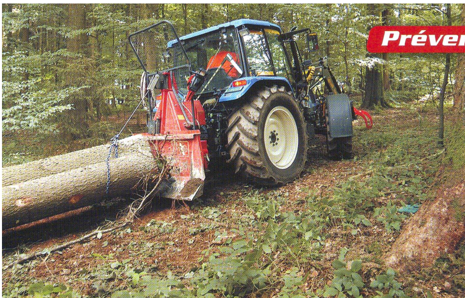
Toute personne voulant travailler en forêt a besoin de tracteurs et de treuils sûrs et appropriés.

de 9 h à 11 h et de 14 h à 16 h, au tarif ordinaire.