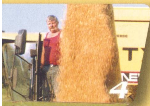
TA spécial Moissonneuses-batteuses