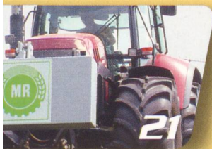
Economie Utiliser en commun