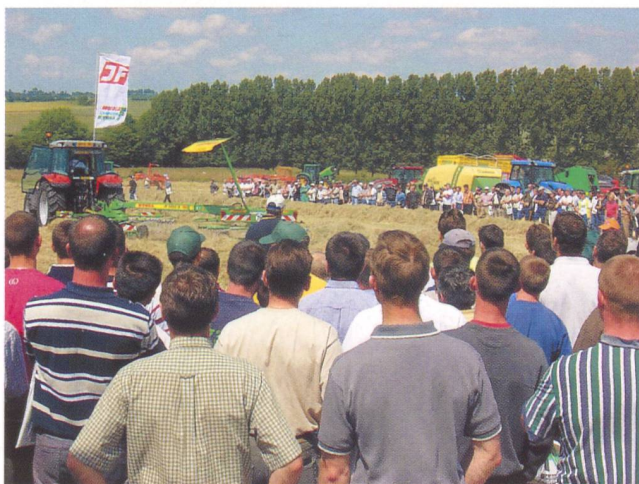
Les démonstrations de machines du Rallye de l'Herbe sont commentées.

Depuis son lancement en 1999, le Rallye de l'Herbe parcourt à chaque édition entre 3 et 7 étapes, avec 1000 à 3000 visiteurs professionnels à chacune d'entre elles. En 2006, les organisateurs attendent plus de 8000 visiteurs au total. Pour le réseau CUMA (coopératives d'utilisation de matériel agricole), la récolte de l'herbe constitue une activité majeure. Elle est présente dans plus de la moitié des groupes, et les CUMA achètent plus du quart des presses ou des faucheuses-conditionneuses vendues en France.