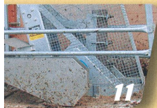
Technique à la ferme Brasseurs