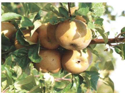
Sauvegarde et commercialisation d'anciennes variétés fruitières arboricoles