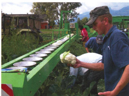
Schweizer Blumenkohl tiefgefroren