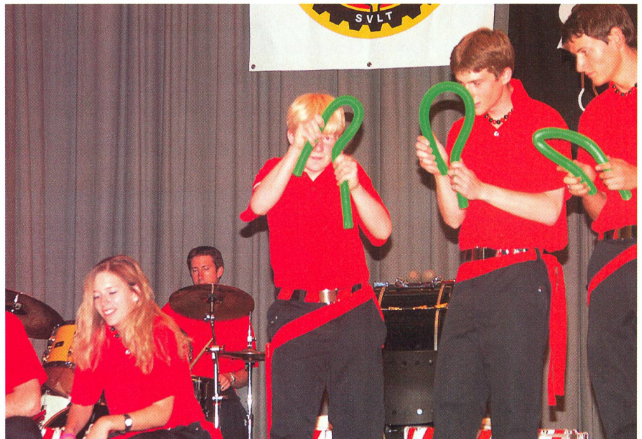
Les «Querschleger», l'excellent groupe de percussionnistes qui a soulevé l'enthousiasme des spectateurs (pour plus de renseignements, voir sous www.querschleger.ch )