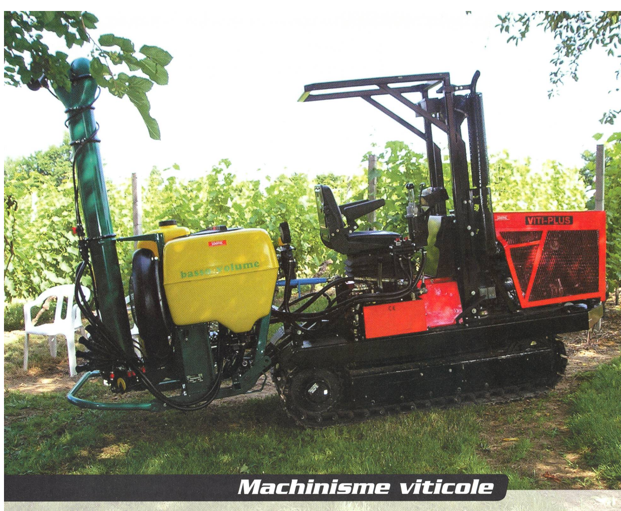
Viti-Plus, le tracteur à chenilles de Loeffel. Longtemps dominés par trois acteurs, ce marché se diversifie avec l'arrivée de Rotair et Geier sur le marché suisse