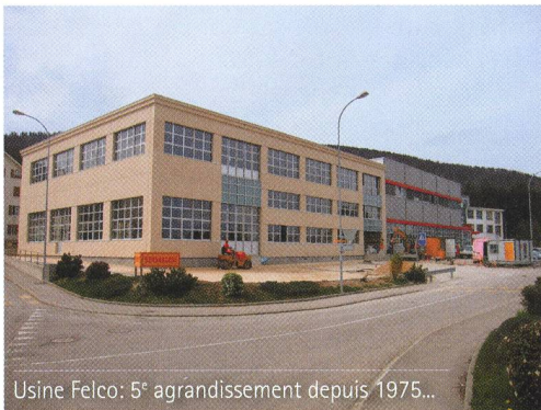
Usine Felco: 5 e agrandissement depuis 1975...

l'Afrique du Sud et Israël font la connaissance des sècheurs fabriqués dans le Jura neuchâtelois. Outre le modèle classique créé en 1948, Felco développe et lance sur le marché diverses innovations dont la poignée tournante en 1966, le sècheur pneumatique (FELCOmatic) en 1974 ou encore le sècheur électrique (FELCOtronic) en 1991.