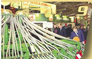
Voyage des lecteurs Agritechnica