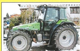
Deutz-Fahr AgroStar 6.38 A, 1994, 125 ch, Fr. 59 999.-, pneus ar. 600/65 R38, pneus av. 480/65 R28, Strebel Traktoren AG, 056 664 12 10 [10036]