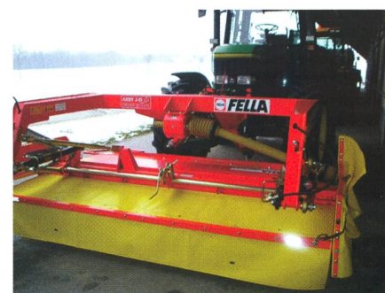
Porte-à-faux avant: selon la législation, il peut atteindre au plus 4 mètres mesurés depuis le centre du volant.