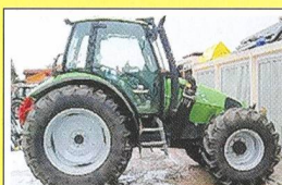
Deutz-Fahr Agrotron 105 Mk2, 2000, 105 ch, Fr. 69 999.-, pneus ar. 600/65 R38, pneus av. 540/65 R24, Strebel Traktoren AG, 056 664 12 10 [10049]