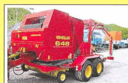
New Holland, combinaison à bobiner 648, 4355 tout-terrain, 2000, Fr. 32 500.-, très bon état, Kuoni Landtechnik AG, 062 877 11 55 [10050]