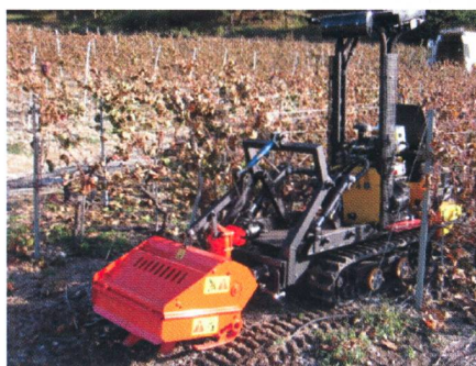
Et voici le fameux porte-outil de Chappot.

Aujourd'hui, Chappot SA est présent à Charrat, Saxon et Vétroz. L'entreprise occupe 24 personnes et ses Multi JYP sont présents en Suisse, en France, en Espagne, au Portugal,