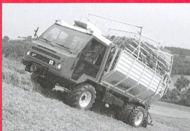
Transporters de 61 jusqu'à 91 CV