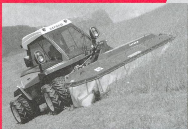
Faucheuses à 2 essieux de 40 jusqu'à 68 CV