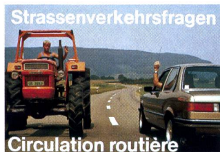
Côte à côte dans le trafic routier!

La chute de la Caravelle HB-ICV Swissair en septembre 1963 reste dans toutes les mémoires, particulièrement dans les milieux agricoles. D'un seul coup, de nombreux enfants de la région zurichoise de Humlikon perdirent leurs parents et les entreprises agricoles leurs forces de travail et leurs chefs d'exploitation. Une large mobilisation pour ce village agricole a permis de mettre sur pieds un programme d'aide. L'ASETA organisa la mise à disposition de tracteurs et de machines, de manière à assurer les travaux de récolte urgents.