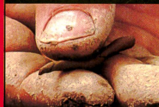
Protection du sol: Le soutien de TASC