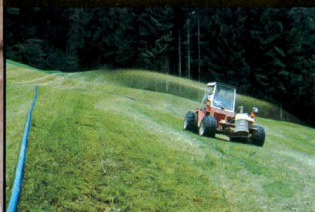
Epandage de lisier