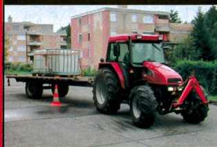
Cours de conduite G40