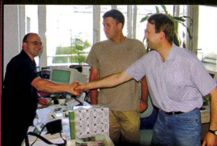
Ristournes de carburant