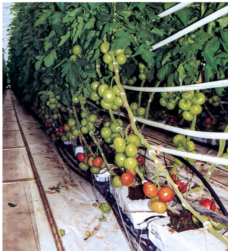
Tomates sous abri chez Blanc & Frères à Montagny-près-Yverdon: Cultivée sur substrat, la production s'échelonne de mai à novembre. Récolte annuelle moyenne: 45 à 52 kg de fruits par plant.