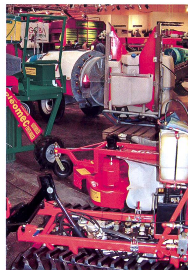
Une variété inouïe: En marge de la technique de production pour animaux, un choix important de machines et d'appareils pour l'horticulture, la viticulture et le maraîchage.