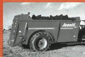
Epandeur à vis verticales Jeantil 10.5-18 m³