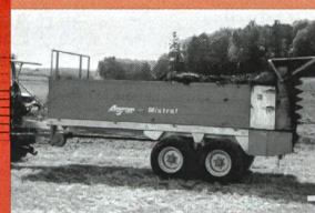
Epandeur Agrar Mistral avec essieux bogie 7-9 m³