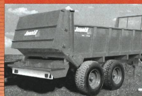
Epandeur large Jeantil 9-16 m³