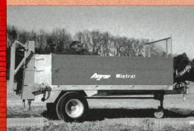
Epandeur Agrar Mistral 5-7 m³