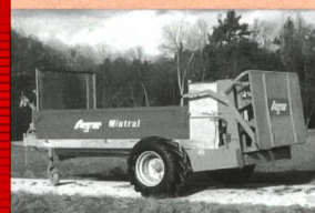
Epandeur Agrar Mistral surbaissé 3.5 m³

Technique et qualité de pointe pour des perfor- mances supérieures