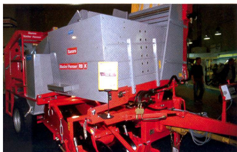
Samro, très engagé dans l'exportation.