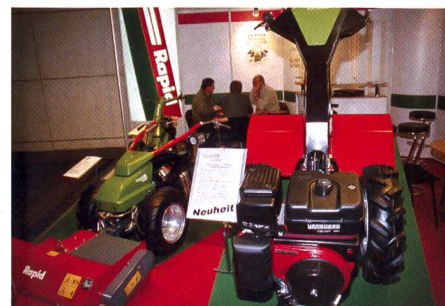
Bon départ pour Rapid avec le nouvel Universo à côté du Mondo et de l'Euro.