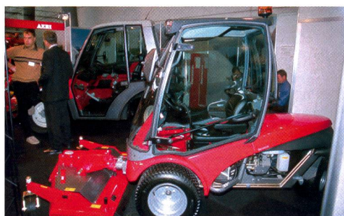
Aebi Berthoud allie un bon design à une technique multifonctionnelle.