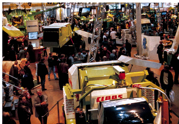
Agritechnica: la foire la plus complète de l'agro-équipement dans de superbes halles.

Ne sont pas compris: tous les autres repas, toutes les boissons, le supplément pour chambre à 1 lit, CHF 100.– par nuit, voyages indivi-