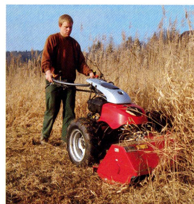
Nouveau: la motofaucheuse hydrostatique Combicut Aebi CC66.

deux rapports (terrain /route). Avec son angle de braquage de 40° à l'avant comme à l'arrière, le nouveau Terratrak 4x4 est très maniable. La cabine étanche aux poussières est très spacieuse. L'écran de l'ordinateur de bord de série affiche les réglages et l'état des fonctions les plus importantes. Le levier multifonctions peut commander 24 fonctions, sans devoir changer de main. Une climatisation intégrée permet au conducteur de garder la tête froide à tout moment.