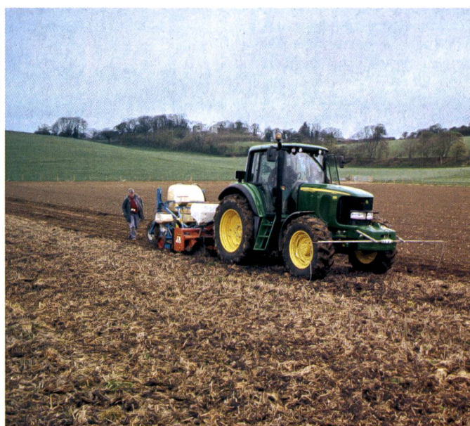
Le semis en bande fraisée prend pied en Grande-Bretagne.