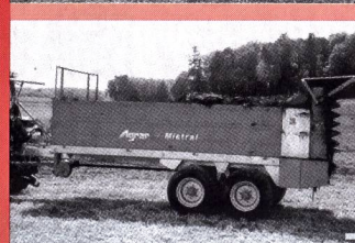
Epandeur Agrar Mistral avec essieux bogie 7-9 m 3