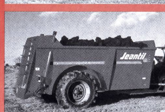
Epandeur à vis verticales Jeantil 10.5-18 m 3