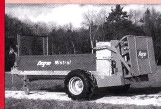
Epandeur Agrar Mistral surbaissé 3.5 m 3

Technique et qualité de pointe pour des performances supérieures