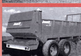
Epandeur large Jeantil 9-16 m 3