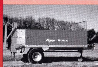
Epandeur Agrar Mistral 5-7 m 3