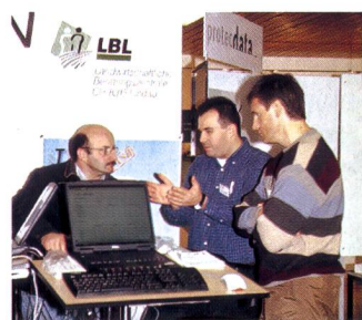
Actualiser ses logiciels, examiner du nouveau matériel...

Aux logiciels comptables du début de l'informatique agricole ont succédé les programmes de gestion de stock, d'affouragement, les calculs des frais de machines, les plans de fumure, etc. etc. Les