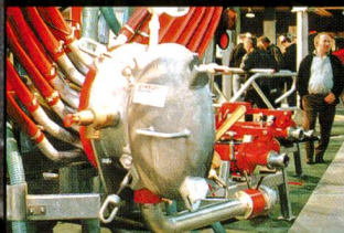
Tier & Technik