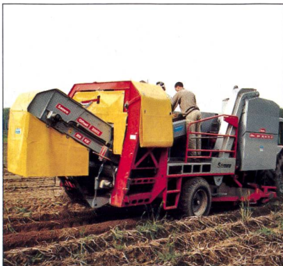
Samro Offset 2002 KK avec benne auxiliaire

... la qualité de la récolte doit être conservée au maximum.