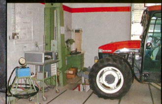
Les nouveaux tracteurs testés