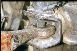
Le bon attelage