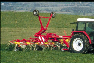
Pirouettes et andaineurs