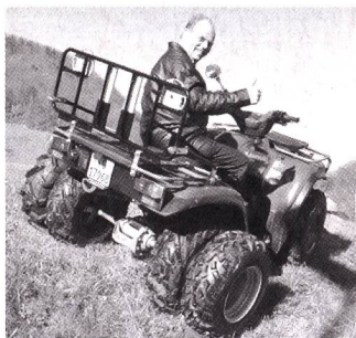
Véhicule avec roues jumelées «clic» montées

Incroyable mais vrai... les tout nouveaux jumelages «Clic» de GS-Schaad se changent vraiment plus vite que les roues de formule 1, et, en plus, par une seule personne. Resserrer, inutile, puisque ces nouvelles roues se cliquent et sont aussitôt enlevées, tout ça sans outil. Un tout nouveau système, basé sur la fixation à baïonnette, rend la chose possible. Clippées une fois, les roues jumelées tiennent comme du béton.