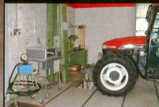
Le test de tracteurs FAT