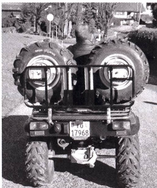
Quad accompagné par ces roues jumelées sur la fixation

qui se vissent sur les moyeux de roue, et une fois cet adaptateur monté, «y a plus qu'à cliquer». Autre chamboulement technique: les roues jumelées sont solidarisées au véhicule par un simple support. Quand la route est étroite, quand la vitesse fait envie... les roues jumelées sont «décliquées» de l'axe sur le support. Ce qui rend les machines et véhicules plus souples et permet un plus grand rayon d'action.