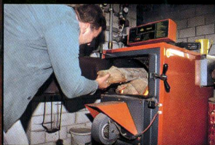
Chauffages à bois