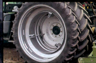
Pneumatiques du tracteur