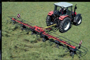
Rallye de l'herbe