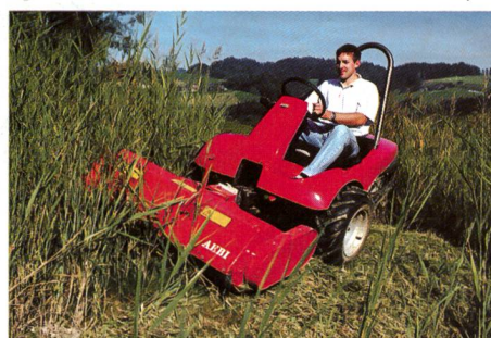
Terracut Aebi TC07: Véhicule porte-outils 3 roues multifonctions et hydrostatique, particulièrement sûr en pentes, avec traction intégrale et Active Traction Control (ATC).

La transmission hydrostatique, la direction articulée hydraulique 55° d'une grande aisance, la traction intégrale, la robuste hydraulique avant et arrière et la cabine confort spacieuse, efficace et insonorisée (malgré sa largeur de véhicule variable de 120 à 155 cm) avec un accès très bas, ne sont que quelques-unes des qualités qui font du KommunalTrak Aebi KT50 facile d'entretien, un instrument de travail intéressant et économique.