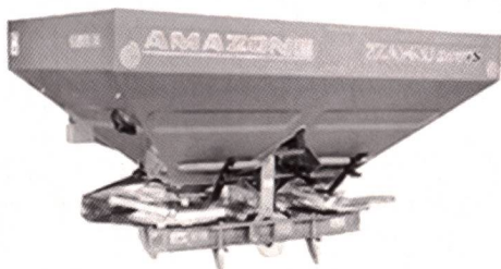
ZA-M iS en action

Les distributeurs ZA-M iS sont livrables avec des capacités de 1000 à 3000 litres et des largeurs d'épandage de 10 à 48 mètres. Sur demande tous les ZA-M iS