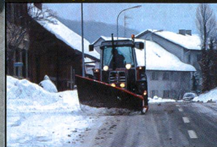
Rapport FAT 569