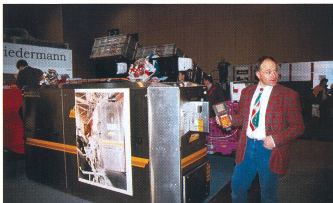
Distributeur automatique de nourriture dans les étables à l'attache: une méthode qui permet de rationaliser et d'alléger un travail quotidien durant 365 jours.

geuses, avec système de pesage et des programmes de mélanges de fourrage intégrés, attirent aussi le regard de même que les distributeurs automatiques de ration qui trouvent aussi bien leur place dans les stabulations libres que dans les étables à l'attache. Il est bizarre cependant que de trouver si peu de ces précieux auxiliaires de ferme que sont les chariots élévateurs