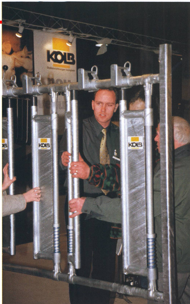
L'exposition Tier & Technik, une plate-forme pour présenter des systèmes novateurs améliorant la détention des animaux: cornadis respectueux de l'espèce.