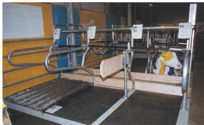
Les stabulations à logettes sont toujours plus nombreuses. Des matelas pour le confort des animaux, un procédé apprécié, surtout lorsque la paille se fait rare.