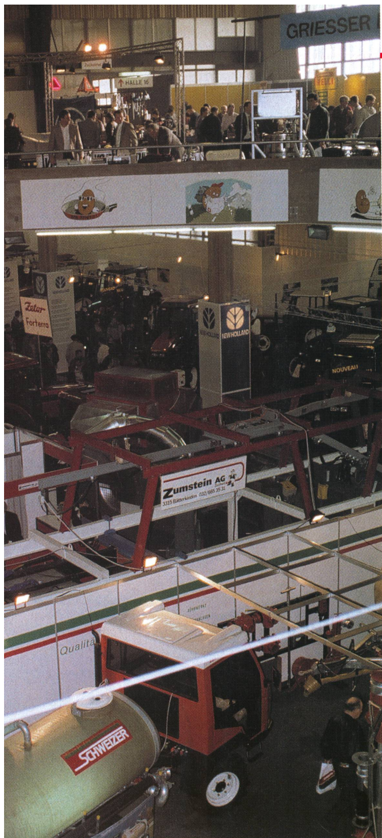
De la technique agricole à l'état pur... L'événement marquant de l'année pour la dernière fois dans les balles du Palais de Beaulieu.

diminuer la charge au sol et d'autre part pour intervenir avec une mécanisation plus douce, qui favorise aussi les machines attelées.