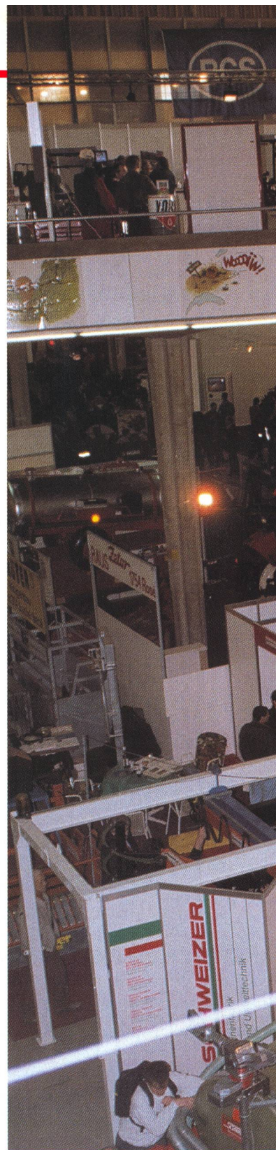
Des informations de première main sur le sujet, au stand de l'ASETA, halle 1.