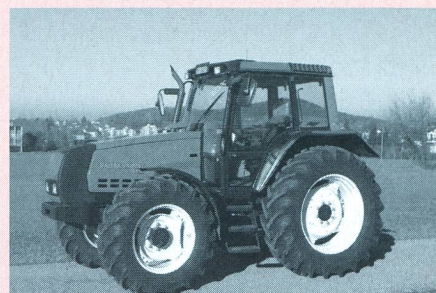
Tracteur VALMET 6850-4 HiTech, moteur turbo quatre cylindres avec refroidissement d'air de suralimentation, 88 kW (120 CV), transmission à 3 paliers de charge, poids 4720 kg, (prix catalogue: Fr. 96 900.-), rapport de test n° 1800/00.