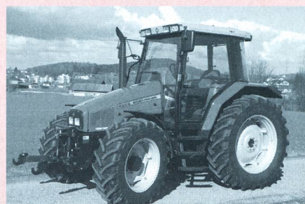
Tracteur MASSEY FERGUSON 6255, moteur turbo quatre cylindres, 70 kW (95 CV), transmission à 4 paliers de charge, hydraulique et prise de force frontales, poids 4870 kg (prix catalogue: Fr. 106 425.-), rapport de test n° 1803/00.