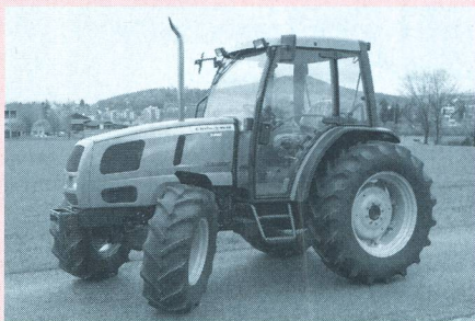
Tracteur LANDINI Globus 65 Turbo, moteur turbo quatre cylindres, 55 kW (75 CV), transmission à 2 paliers de charge, poids 2920 kg (prix catalogue: Fr. 61 200.-), rapport de test n° 1811/00.