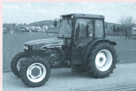
Tracteur NEW HOLLAND TN 75 F, moteur à aspiration quatre cylindres, 56 kW (76 CV), transmission à 2 paliers de charge, essieu avant SuperSteer, poids 2810 kg, (prix catalogue: Fr. 71 800.-), rapport de test n° 1812/00.