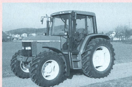
Tracteur JOHN DEERE 6310, moteur turbo quatre cylindres, 74 kW (100 CV), transmission à 4 paliers de charge, suspension avant, poids 4920 kg, (prix catalogue: Fr. 102 685.-), rapport de test n° 1801/00.