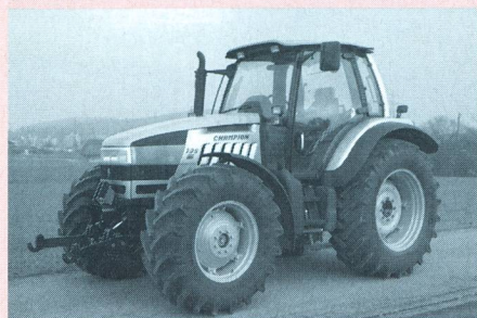
Tracteur LAMBORGHINI Champion 135, moteur turbo six cylindres, trois soupapes, 99 kW (135 CV), transmission à 18 paliers de charge en deux groupes, hydraulique et prise de force frontales, poids 7200 kg (prix catalogue: Fr. 137 900.-), rapport de test n° 1798/00.