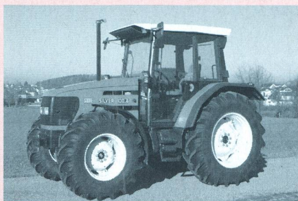
Tracteur SAME Silver 100.4, moteur turbo quatre cylindres avec refroidissement d'air de suralimentation 74 kW (100 CV), transmission à 3 paliers de charge, poids 4250 kg (prix catalogue: Fr. 86 100.-), rapport de test n° 1799/00.