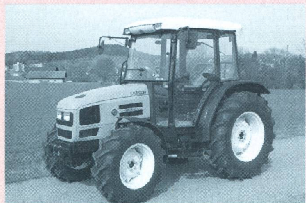
Tracteur HÜRLIMANN XA 656, moteur turbo trois cylindres, 46 kW (63 CV), transmission à 3 paliers de charge, poids 2830 kg (prix catalogue: Fr. 61 200.-), rapport de test n° 1809/00.