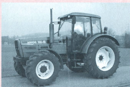
Tracteur ZETOR 116 41, moteur à aspiration, six cylindres, 81 kW (110 CV), transmission à 3 paliers de charge, poids 4610 kg, (prix catalogue: Fr. 95 138.-), rapport de test n° 1802/00.