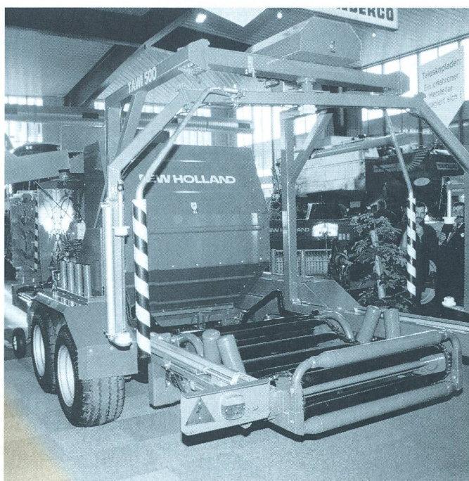
L'AGRAMA 2001 du 25 au 29 janvier est ouverte de 9 h à 17 h.

Cette année, le stand de l'Association suisse pour l'équipement technique de l'agriculture mettra l'accent sur la circulation des véhicules agricoles: dans les questions touchant de près les véhicules agricoles comme les limites de poids, les largeurs et les transports, l'ASETA a obtenu des améliorations considérables, grâce à son engagement. L'exemption de la RPLP pour les véhicules à plaques vertes et le remboursement de cette même redevance pour le bois transporté de la forêt aux scieries en sont deux exemples convaincants. En plus, le stand ASETA propose des informations à tous ceux qui recherchent des solutions optimales concernant l'immatriculation de leur parc de machines. Cela touche aussi la largeur des véhicules ou l'angle de visibilité qui doit rester libre malgré les roues larges ou jumelées; là aussi, une amélioration des prescriptions facilite l'emploi de ces véhicules. Un des allègements certains en matière de TVA est en vue dans les prestations des entrepreneurs agricoles puisque l'an prochain verra enfin la facturation de semences et d'engrais à un taux de TVA réduit.