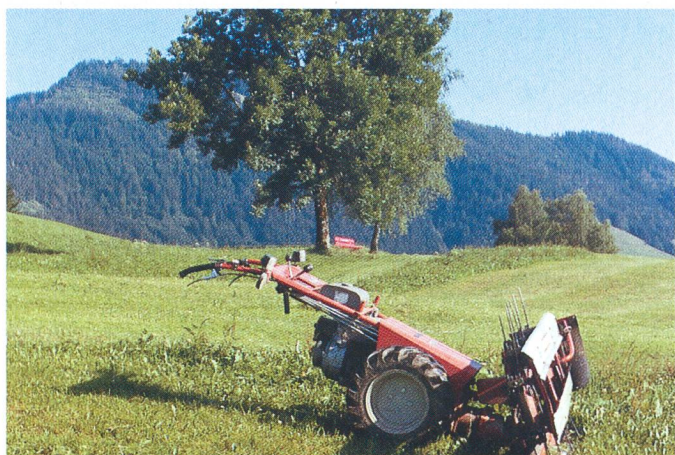
Idylle chemin faisant, sur le Zugerberg.