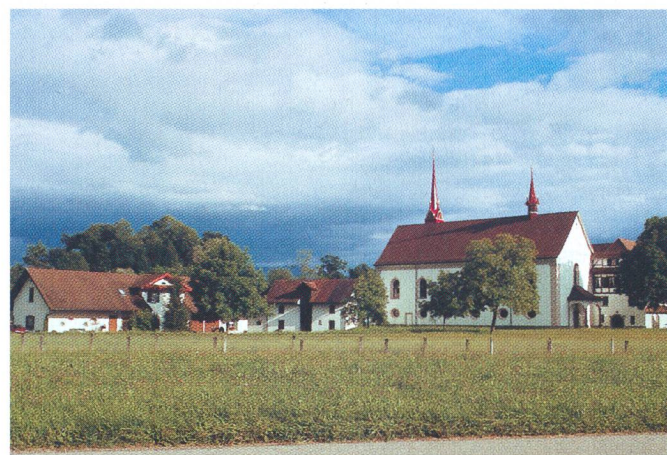
Idylle au bord de la Lorze, couvent des Cisterciennes de Frauenthal.