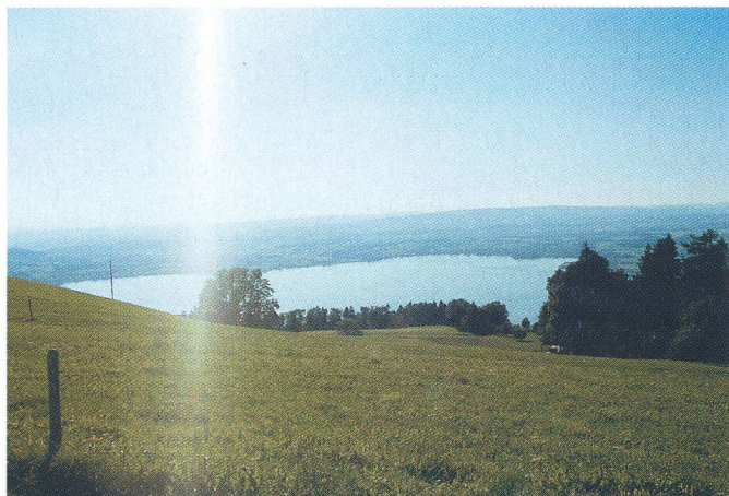
Idylle... à l'horizon, le lac de Zoug.