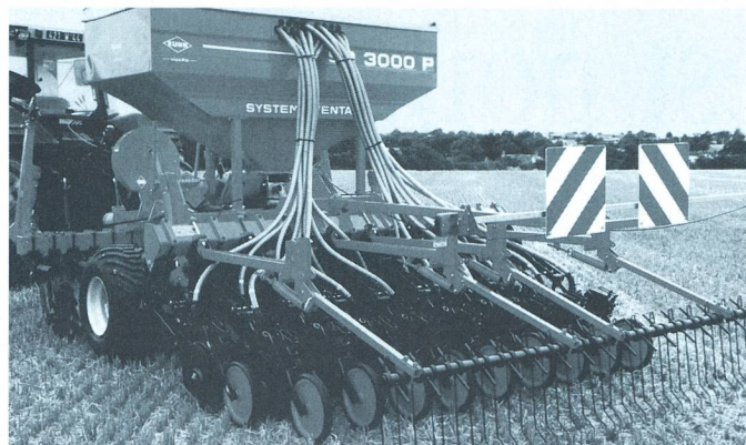
Semoir KUHN SD porté.

25 ans d'expérience dans la construction de semoirs directs font de Kuhn-Huard l'un des spécialistes de la préparation minimale du sol et ce n'est pas moins de 2000 unités qui sont en service – avec succès – dans le monde entier.