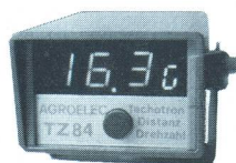
grands chiffres lumineux

indique: km/h, distance, nombre de tours, prise de force