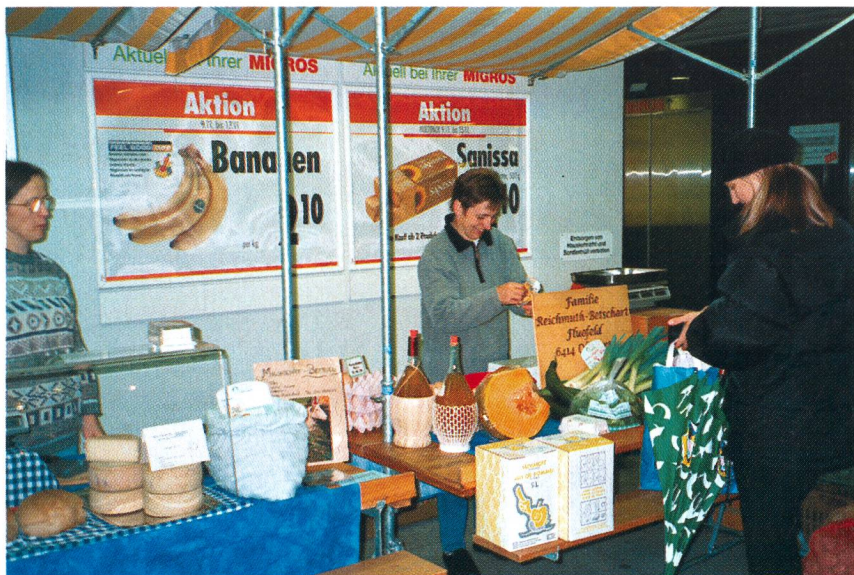
Le banc de marché devant la Migros de Brunnen. Le grossiste soigne son image de marque en accordant une bonne place à la marchande.