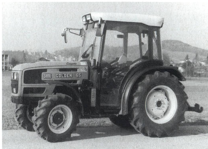
Fig. 10: Tracteur SAME Golden 65, moteur turbo trois cylindres de 48 kW (65 CV), boîte de vitesses à passage sous charge à 3 rapports (prix catalogue: Fr. 63 200.-).