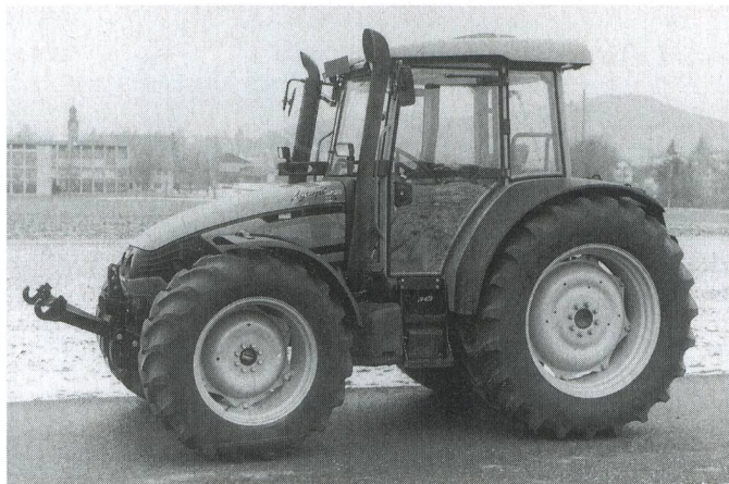
Fig. 8: Tracteur DEUTZ-FAHR Agroplus 95, moteur turbo quatre cylindres de 70 kW (95 CV), boîte de vitesses à passage sous charge à 3 rapports, système hydraulique et prise de force frontaux (prix catalogue: Fr. 90 300.-).

Oxyde d'azote \leq 10,5 g/kWh* Monoxyde de carbone (CO) \leq 5 g/kWh* Fumée noire: \leq 3,0 IN (Bosch) Consommation de carburant lors du test à huit paliers: \leq 290 g/kWh* (* Valeurs à la prise de force)