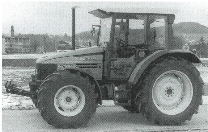
Fig. 3: Tracteur HÜRLIMANN XT 910.4, moteur turbo quatre cylindres de 76 kW (103 CV), boîte de vitesses à passage sous charge à 3 rapports (prix catalogue: Fr. 86 500.-), système hydraulique et prise de force frontaux (supplément de prix: Fr. 7800.-).

Le tracteur à moteur six cylindres est plus lourd et plus long. Cette longueur plus importante le rend plus stable, aussi bien dans son comportement général que lors de transports sur route ou de travaux de traction difficiles en plein champ. Les outils attelés à l'arrière déchargent moins l'essieu avant du tracteur en raison de l'empattement supérieur. Les caractéristiques du six cylindres et son couple-moteur à bas régime le rendent particulièrement adapté au démarrage avec de lourdes charges.