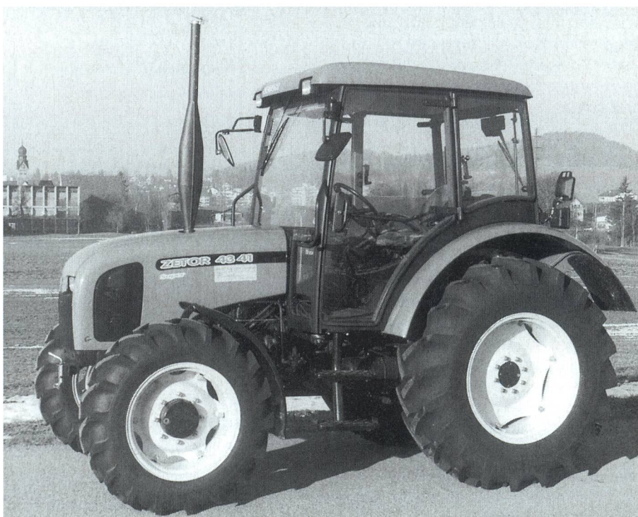
Fig. 11: Tracteur ZETOR 4341 Super, moteur d'aspiration quatre cylindres de 44 kW (60 CV), boîte de vitesses à 5 rapports partiellement synchronisée (prix catalogue: Fr. 55 806.-).

La consommation spécifique de carburant est la seule mesure directement comparable permettant de juger de l'économie d'un tracteur. Comme un tracteur ne fonctionne que rarement à puissance maximale, le tableau indique une consommation de carburant à charge partielle de 42,5% et pour une puissance à la prise de force de 540 ou 1000 min -1 . Une consommation de moins de 300 g/kWh peut être considérée comme favorable.