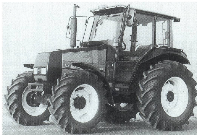
Fig. 6: Tracteur VALMET 700-4, moteur turbo trois cylindres de 51 kW (70 CV), boîte de vitesses synchronisée à 4 rapports (prix catalogue: Fr. 54 000.-).