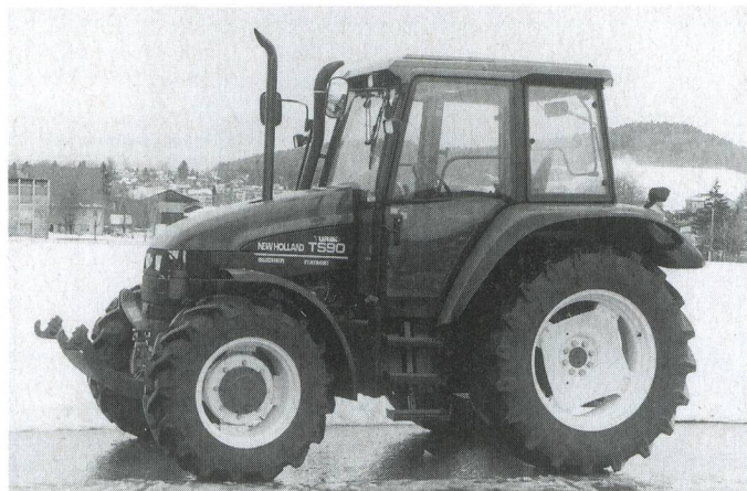
Fig. 7: Tracteur NEW HOLLAND TS 90, moteur turbo quatre cylindres de 70 kW (95 CV), boîte de vitesses à passage sous charge à 4 rapports, système hydraulique et prise de force frontaux (prix catalogue: Fr. 97 560.-).