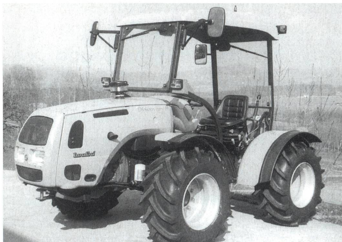
Fig. 9: Tracteur réversible LANDINI Discoveri 85, moteur turbo quatre cylindres de 59 kW (80 CV), boîte réversible synchronisée (prix catalogue: Fr. 55 800.-).