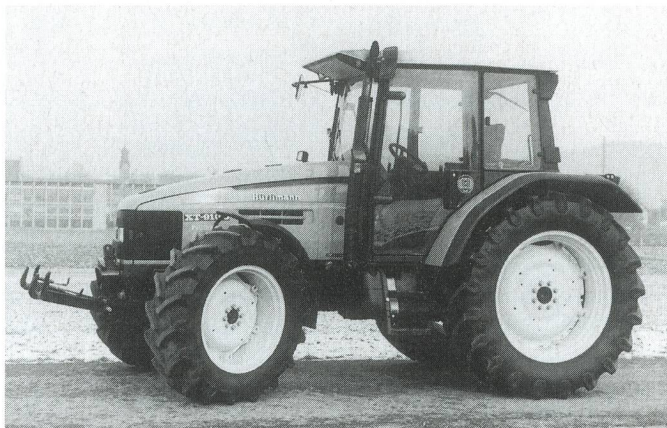
Fig. 4: Tracteur HÜRLIMANN XT 910.6, moteur d'aspiration six cylindres de 77 kW (105 CV), boîte de vitesses à passage sous charge à 3 rapports (prix catalogue: Fr. 93 500.-), système hydraulique et prise de force frontaux (supplément de prix: Fr. 7800.-).