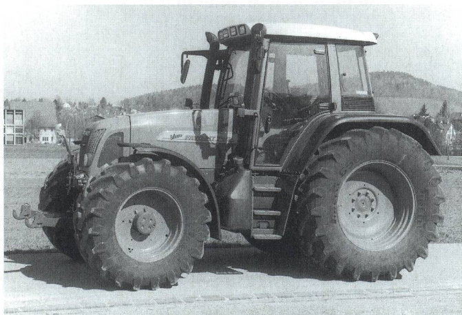
Fig. 5: Tracteur FENDT Favorit 716 Vario, moteur turbo six cylindres de 118 kW (160 CV), boîte de vitesses en continu, système hydraulique frontal (prix catalogue: Fr. 172 500.-).

Bruit à l'oreille du conducteur: \leq 80 dB(A) Bruit au passage: \leq 85 dB(A) Gaz d'échappement Hydroxyde de carbone (HC) \leq 1,5 g/kWh*