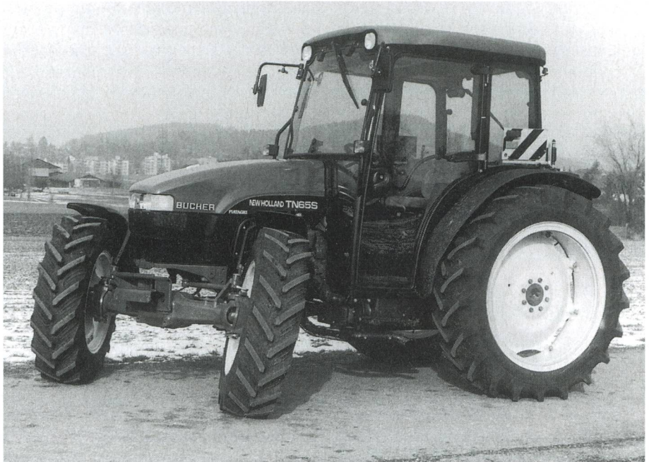
Fig. 2: L'essieu avant SuperSteer permet d'accroître l'angle de braquage de 55 à 76°. Le rayon de braquage se réduit de 7,9 à 6,8 m.

Les constructeurs de moteurs doivent donc prendre des mesures sévères afin de réduire les émissions . Les turbocompresseurs avec refroidissement d'air de suralimentation, des mesures techniques au niveau de la tête du cylindre, ainsi que des améliorations du système d'injection sont autant de mesures poursuivant cet objectif. L'air rapidement comprimé dans le turbo s'échauffe et subit une certaine dilatation. Le meilleur remplissage des cylindres avec de l'oxygène grâce à la compression est contrarié de ce fait. Le refroidissement de cet air comprimé permet de valoriser cet apport d'air de façon optimale. Quatre soupapes au lieu de deux favorisent les échanges gazeux (fig. 1). L'augmentation de la pression d'injection à quelque 2000 bar, ainsi que le réglage électronique de la quantité injectée et de son déclenchement permettent d'optimiser le phénomène de combustion dans le cylindre. Ces diverses mesures permettent de réduire les émissions de gaz d'échappement et de bruit. Une réduction supplémentaire de celles-ci pourrait être obtenue par l'utilisation de pompes individuelles commandées par des soupapes magnétiques et d'un système Common-Rail. L'objectif doit cependant rester la diminution des émissions des moteurs sans pour autant préteriter leur rendement économique (consommation de carburant, frais d'entretien et de construction).