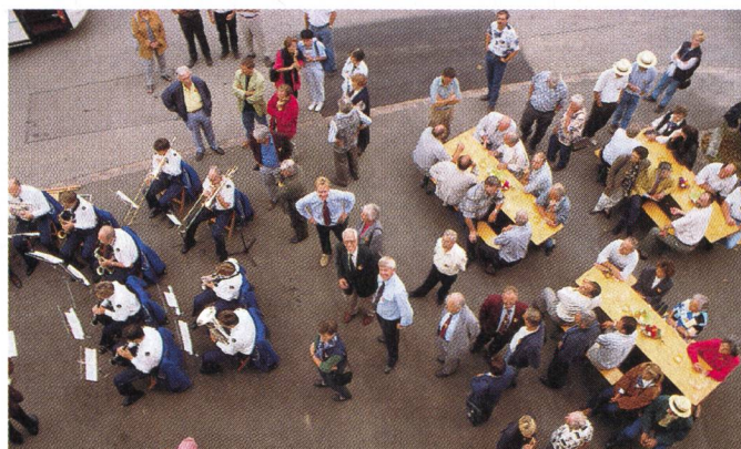
La «Polka des tracteurs» jouée par la fanfare de Riniken, devant le siège de l'ASETA.