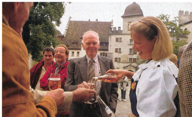
«Un bon vin ne nuit à personne», semble dire le président de la section Neuchâtel (vice-président de l'ASETA) qui attend son tour sur le parvis du château de Lenzbourg.

de l'Association suisse pour l'équipement technique de l'agriculture.