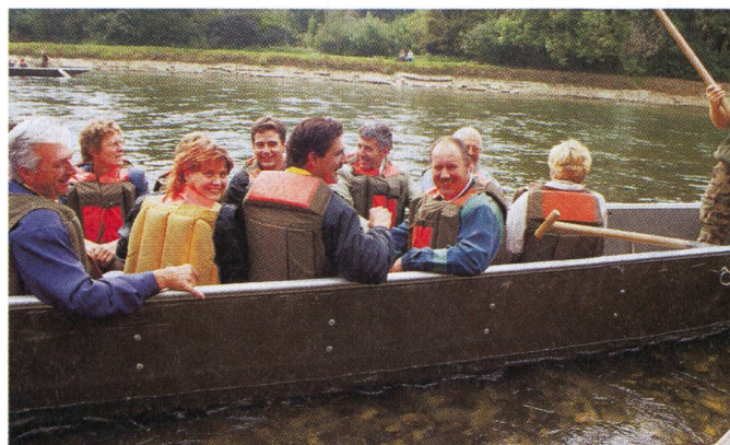
L'assemblée du 75 e : sur la Reuss.