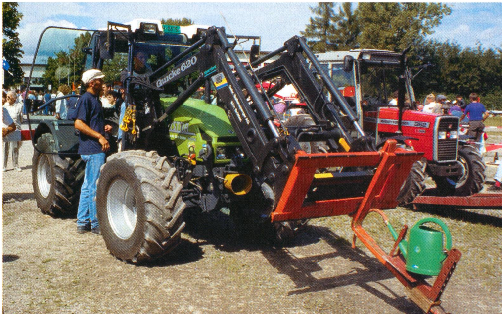
Une grande concentration mène au succès.

Quant au poste «Théorie», les candidats répondront à un questionnaire comportant 40 questions sur le thème de la circulation des engins agricoles. Pour la première fois aussi, les questionnaires de catégorie G et F serviront de base à l'élaboration du concours théorique.