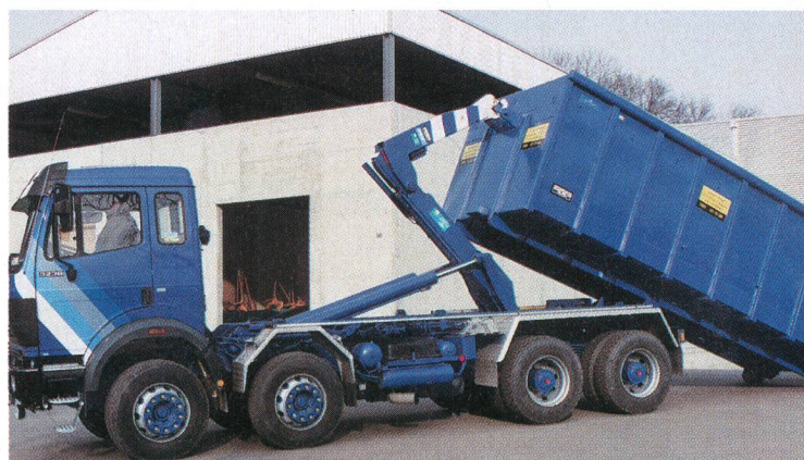
Conteneur de transport destiné à la livraison de blé.

Du point de vue des coûts, les variantes 2 et 3 sont identiques. La variante 2 consiste en une prestation de service complète de la part de l'entreprise. Dans la troisième variante, l'entreprise de travaux agricoles et l'entreprise de transport se partagent le mandat. Dans les deux cas, le mandant ne doit