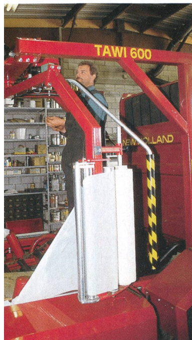
Travaux de finition sur une presse à balles rondes. Un voisin, constructeur génial, l'a équipée d'un élément enrurbanneur.

chines spécialement adaptées à ce type de travail, ce qui améliore la qualité du sol. Quant à l'épandage des boues d'épuration hygiénisées, il se réalise grâce à une installation de conduite, montée à l'avant d'un tracteur. La pompe à moteur, actionnée à distance, est le fruit d'un développement propre. Le transport jusqu'au champ est effectué par une autre entreprise.