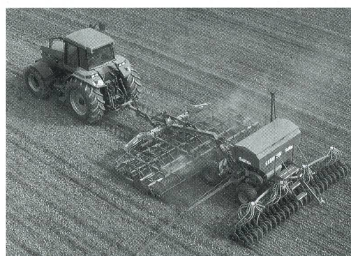
Semoir combiné Kompaktor K 600 A