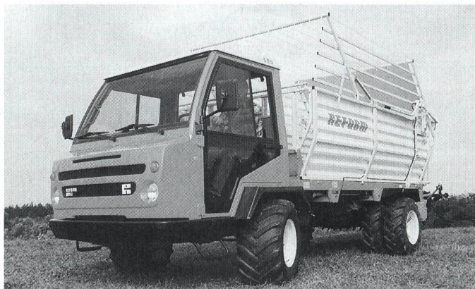
Le nouveau Power Muli, 57 CV

Sous le slogan «encore plus puissant, plus confortable et plus compact», REFORM présente le nouveau MULI power 555 avec 57 CV, en complément au modèle éprouvé MULI 565.