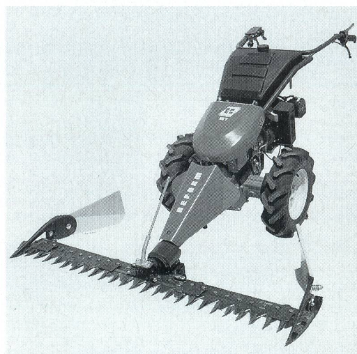
Les nouvelles motofaucheuses M7 et M8/L à entraînement hydrostatique.

La nouvelle série M7/M8 est équipée de l'entraînement hydrostatique et d'un moteur de 9 et 11 CV. Les deux ont un blocage de différentiel pour effectuer des manœuvres sûres. La vitesse d'avancement réglable en continu permet de s'adapter de façon optimale aux différentes conditions de travail et de fauchage. Le modèle L, avec direction automatique, garantit un grand confort de travail pour tous changements de direction et les manœuvres, ceci également en pente.