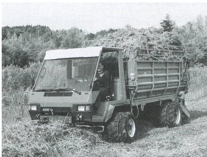
Le Transporter Aebi TP58 avec l'autochargeuse Aebi LD35. Le modèle TP98 se distingue par de nombreuses innovations. La nouvelle autochargeuse comme les Transporter offrent une capacité de chargement élevée.