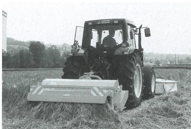
Conditionneur Kurmann K 618 TWIN

Le développement continu de la maison Kurmann permet de présenter à l'AGRAMA 99 trois nouveaux modèles d'éclateurs et l'essieu oscillant éprouvé depuis des années.