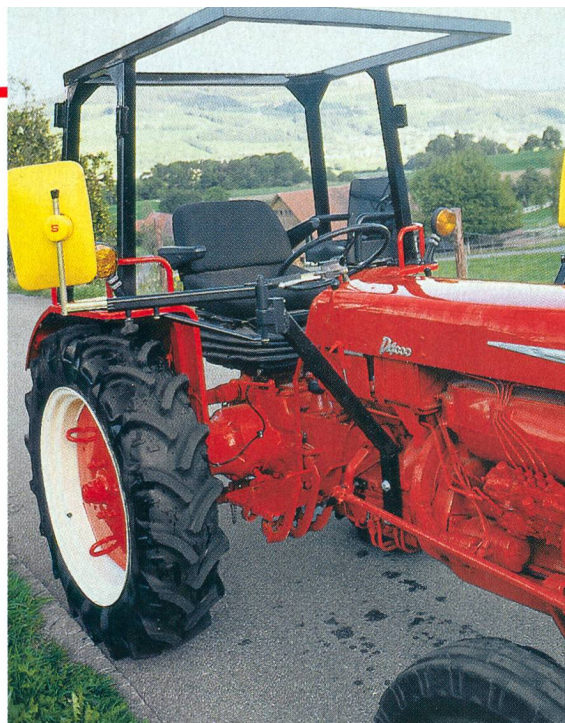
Un dispositif de protection peut sauver la vie. Plus de 300 agriculteurs ne seraient pas décédés si leur tracteur avait disposé de protection du conducteur.