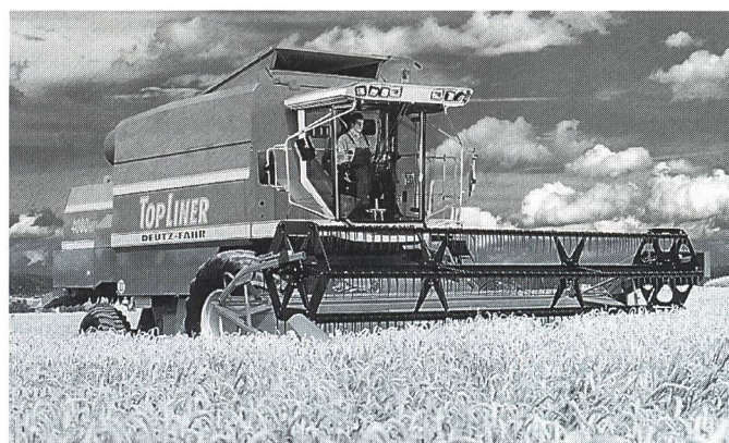
TopLiner 4080 HTS avec 275 CV.