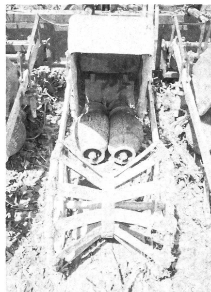
Fig. 2. La combinaison du broyage et de l'arrachage des fanes exige une parfaite pratique culturale et une bonne maîtrise de conduite des machines. Pour atteindre une bonne qualité de travail des ballons en caoutchouc, le sol doit être ressuyé et les moignons secs (poids du tracteur 3600 kg et de la machine 1985 kg).