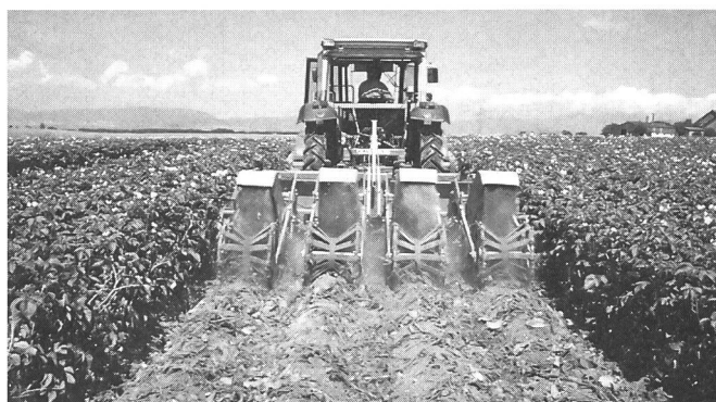
Fig. 1. La combinaison du broyage des fanes et du traitement en bandes permet de diminuer l'utilisation d'herbicides de 60%. A droite: Dans des conditions optimales, le broyage et l'arrachage mécaniques des fanes peuvent être effectués en un seul passage.