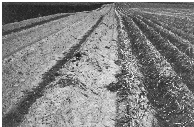
Fig. 4. De gauche à droite: Destruction des fanes et enherbement tardif après le procédé mécanique-chimique; technique de récolte à l'état vert avec réenfouissement des tubercules.