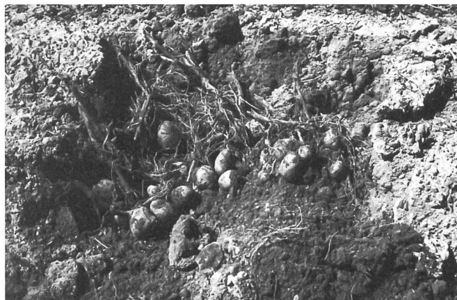
Fig. 3. L'arrachage avec le réenfouissement des tubercules nécessite un bon état sanitaire des cultures, car souvent un grand nombre de tiges restent attachées aux tubercules et sont enfouies avec ceux-ci (risque d'infection élevé, droite).