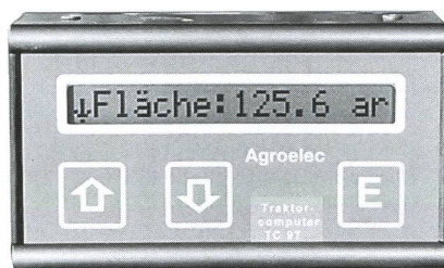
affichage au cadran en français