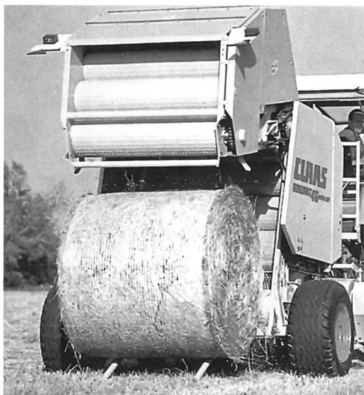
Presse à balles rondes ROLLANT 46 Roto-Cut, la plus vendue de sa classe en Europe