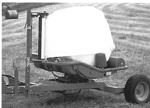
Enrubanneuse UN7335, le modèle sur mesure pour l'agriculteur