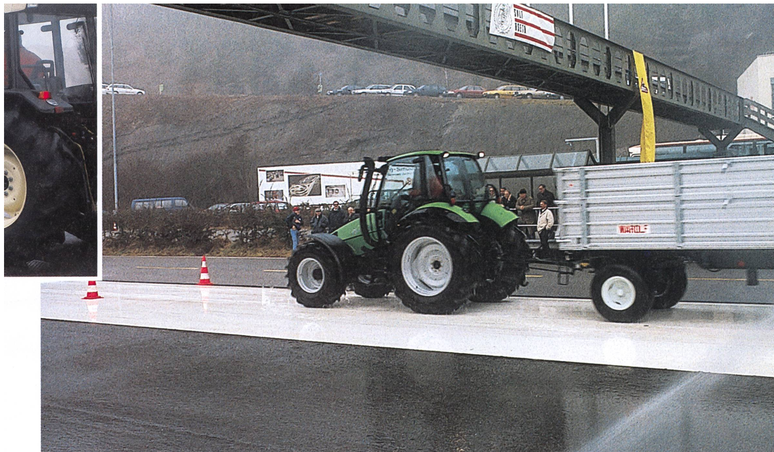
Sentiment de Grand Prix? Peut-être, mais pas sans avoir approfondi les techniques de conduite au centre de Vellheim.

de conduite. Après une brève introduction, place aux démonstrations où, avec force détails – et sans cesse reliés au chauffeur du tracteur par radio – les instructeurs commentent les diverses manœuvres. Ce qui se déroule sous nos yeux est un avant-goût du cours où le plaisir de mieux rouler motive les participants à discerner les risques, à adapter la vitesse à chaque situation donc à maîtriser toujours mieux son véhicule. Comme on le constate, la plus infime des différences de vitesse peut grandement influencer le comportement d'un tracteur et d'une remorque, surtout sur une chaussée mouillée. Ainsi chacun peut apprendre que de subtiles techniques de freinage permettront de meilleures manœuvres pour le tracteur ou tout autre attelage. Aller au delà des limites du véhicule, un thème également brûlant qui figure au programme de ce cours. Son prix: Fr. 300.—.