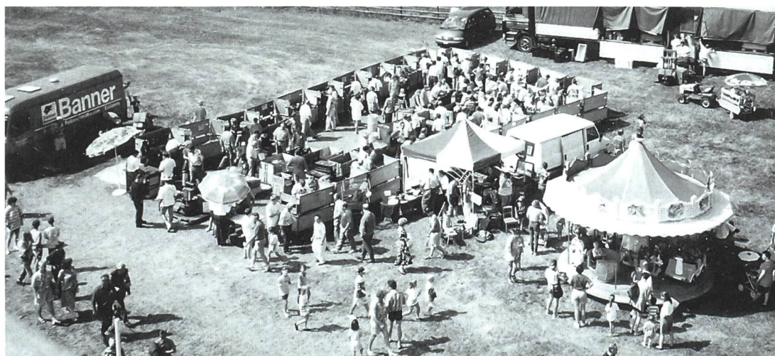
Et un lot de matériel de l'armée à liquider, à des prix hors concurrence.