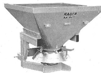
Distributeur de sel.

Le distributeur porté SA, avec des largeurs de distribution de 0,8 à 6,0 m, les distributeurs traînés SU à un disque pour camionnette, camion etc., sans prise de force, ainsi que le distributeur à trémie SPS et BOS