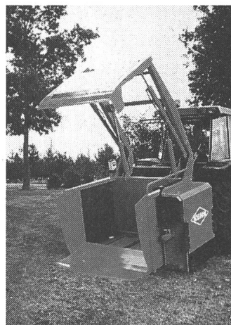
La Silocut de Kuhn facilite votre travail quotidien en améliorant votre confort.

La distribution s'effectue grâce à un démêleur situé sur le côté de la caisse (équipement pour une distribution des deux côtés disponible en option). Le couteau principal et les couteaux