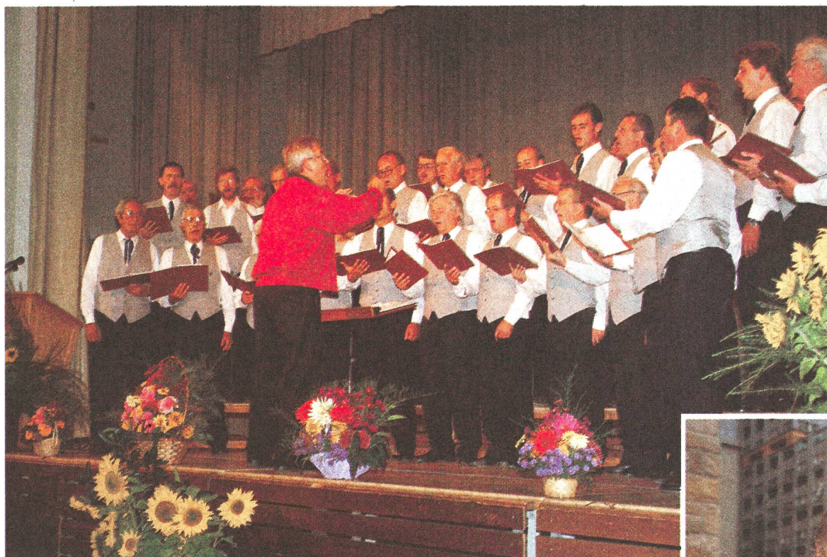
La section vaudoise a mis sur pied un programme exceptionnel pour la soirée du banquet. A entendre, le chœur d'hommes d'Eclépens; à voir, les arrangements floraux.